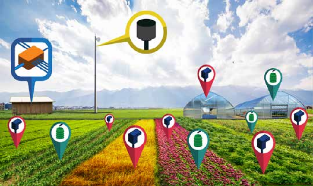
Rys. 3. Bezprzewodowy system czujników pomiarowych i sterowania zaworami Agreus.

przebiegu odczytów miernika wilgotności umożliwia wyznaczenie punktu, odpowiadającego połowej pojemności wodnej. Jest to wartość odczytu od 1 do 2 dni po intensywnych opadach deszczu lub intensywnym nawadnianiu.