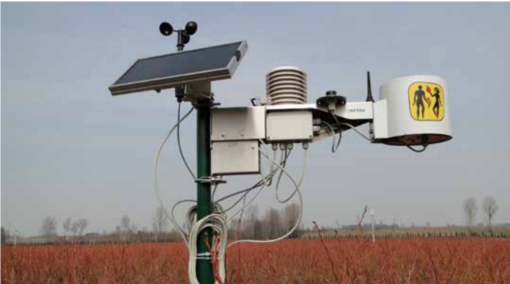
Fot. 1. Automatyczna stacja meteorologiczna

eto, a także aplikacje służące do wyznaczania potrzeb wielu gatunków roślin sadowniczych i warzywnych na podstawie obliczonej wcześniej ewapotranspiracji. Wymienione informacje można znaleźć na stronach: