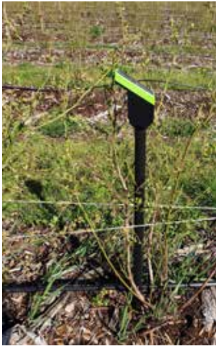
Fot. 3. Tensjometr