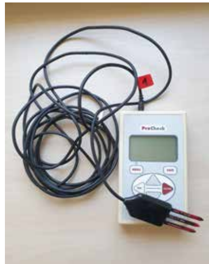
Fot. 4. Miernik z sondą pomiarową

Wilgotność gleby można wyznaczać za pomocą różnego rodzaju mierników. Najprostsze wykorzystują zjawisko wpływu wody na zmiany oporności elektrycznej, mierzonej w porowatym bloczku umieszczonym w glebie. Zaawansowane urządzenia monitorują zmiany przenikalności elektrycznej gleby (Fot 3. ). Czujniki tego typu znajdują coraz szersze zastosowanie do kontrolowania wilgotności gleby w warunkach polowych oraz wilgotności podłoża bezglebowych w uprawach pod osłonami. Zaletą czujników nowej generacji jest łatwa integracja z systemami